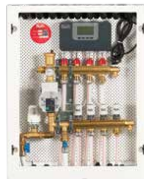
■ Løsning F GV skap med fordeler og ShuntUnit.