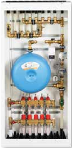
■ Løsning A Roth Kombi Inntaksskap med ekspansjonskar

Typiske eksempler på skap produsert i ulike prosjekter