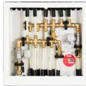
■ Løsning D Roth Quickskap med ny Roth QuickStop.