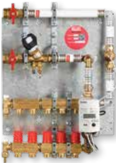
■ Løsning C Roth Unit for montering i allerede eksisterende skap.