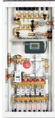
■ Løsning B Roth Kombiskap med styring.