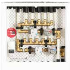
■ Løsning E Roth Maxi skap.