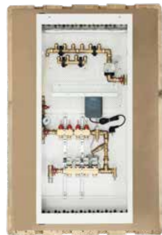
Unngå alt dette, bestill skapet ferdig. Du sparer kostbar tid på utpakking og søppelhåndtering.