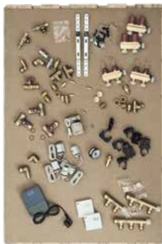
Step 2: Alle deler pakkes ut og sorteres før du kan montere skapet