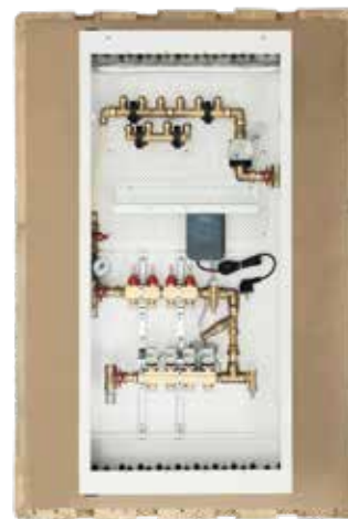
Unngå alt dette, bestill skapet ferdig. Du sparer kostbar tid på utpakking og søppelhåndtering.