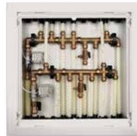
■ Løsning D Roth Quickskap med ny Roth QuickStop.