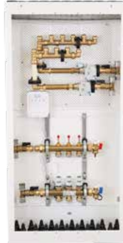
■ Løsning B Roth Kombiskap med enkel styring.