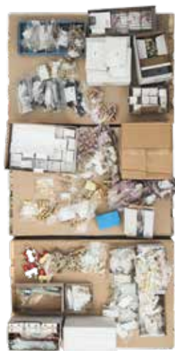
Step 1 : Alle deler leveres på paller