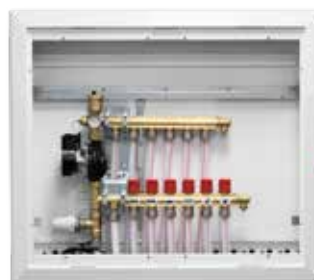
■ Løsning F GV skap med fordeler og ShuntUnit.