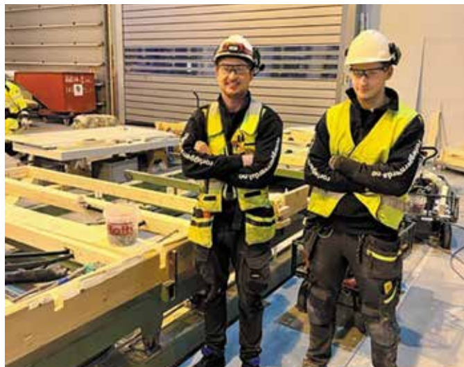
To rørleggere fra Rørleggern i Verdal som jobber på Husfabrikken til Skanska i Steinkjer.

Rørlegger'n Verdal har valgt Roth som leverandør av tappevannsystemer til de 25 boligene, hvor de skreddersydde og prefabrikkerte fordelerskapene kommer til fabrikken med ekspansjonskar og stamme – og kan skrues rett inn i veggene. “En annerledes måte å jobbe på enn på plassbygde boliger, og mye mer effektivt”, forteller de.