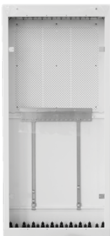
■ Løsning E Roth Kombiskap.