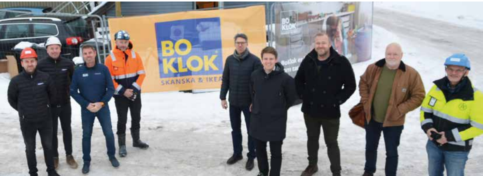
Gjengen som har vært involvert i prosjektet på Åsmoen på Jessheim.