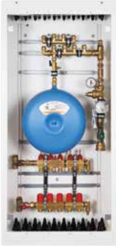
■ Løsning A Roth Kombi Inntaksskap med ekspansjonskar (6 kalde, 4 varme og 5 gulvvarmekurser).

Typiske eksempler på skap produsert i ulike prosjekter